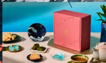
富士山ボックス事例

独立行政法人ジェトロ山梨貿易情報センター、やまなし地域デザイン(株)、(株)山梨日日新聞社、公益社団法人やまなし観光推進機構の4者は今年8月、山梨県の魅力発信事業として山梨県のお菓子と伝統工芸品を詰め合わせた「富士山ボックス」を共同で制作し、株式会社ICHIGOの海外サブスクリプションサービスとの協業により海外180カ国、2万人のユーザーに山梨のお菓子ボックスをお届けいたします。山梨県の豊かな食文化を雄大な富士山とともに世界の国々に発信していきます。今回ボックスに詰め合わるお菓子を広く募集いたします。詳細は裏面をご参照ください。