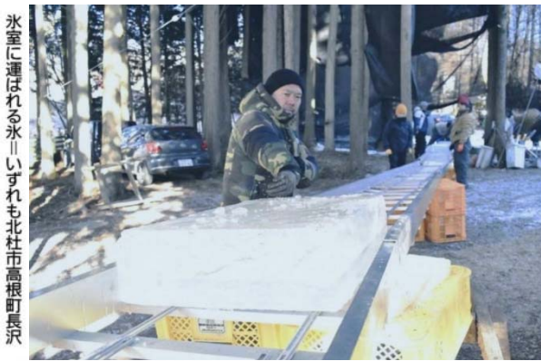
氷室に運ばれる氷。いずれも北杜市高根町長沢